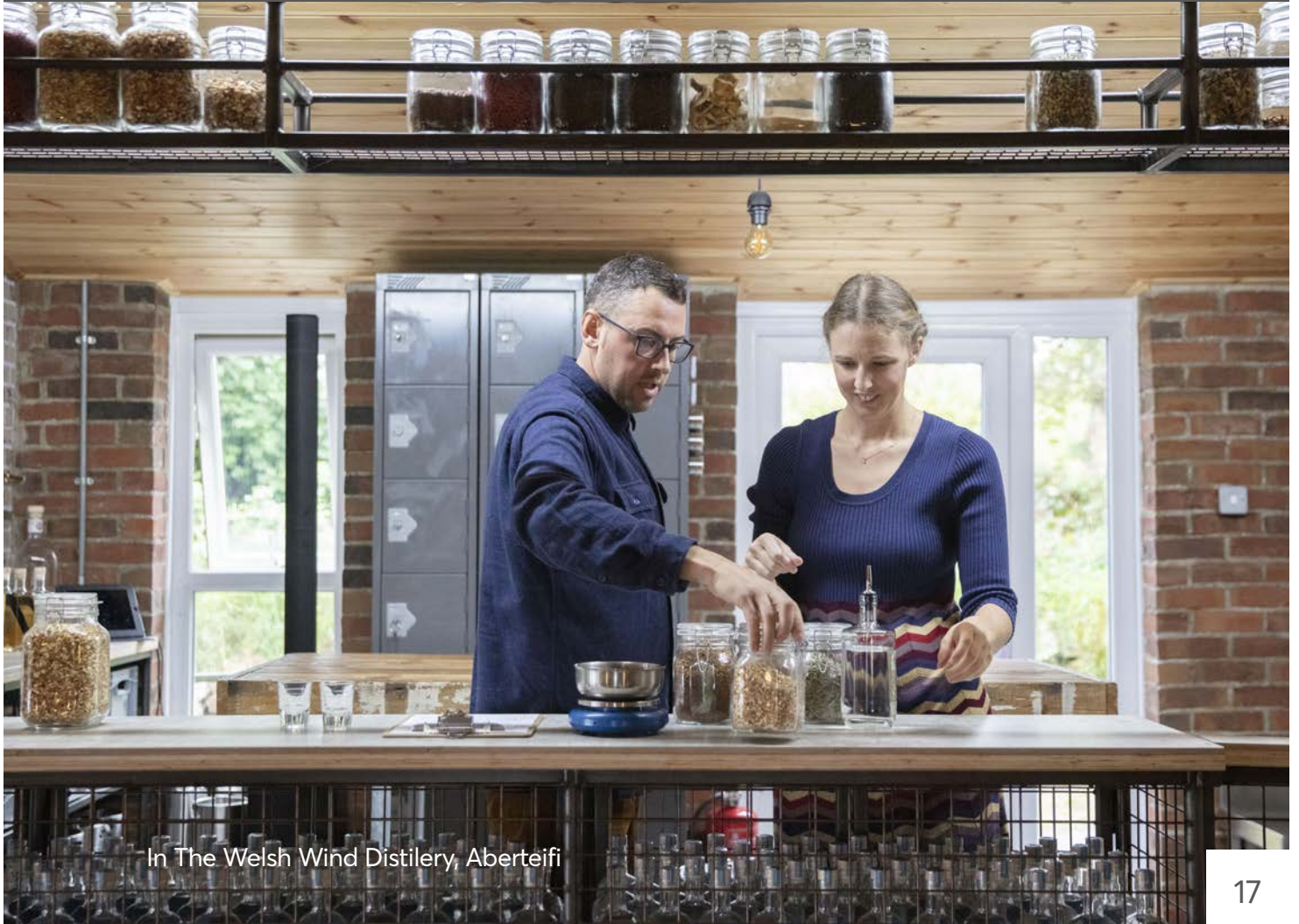
In The Welsh Wind Distillery, Aberteifi