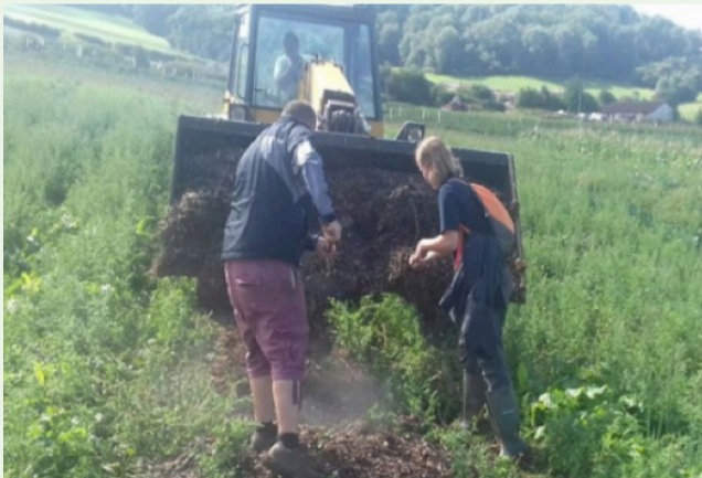
Cliciwch yma i ddarllen mwy .

Ar ôl cynaeafu, gellir ymgorffori'r daenfa i'r pridd gyda gwastraff y cnwd, ac er y gallai fod yn cystadlu am nitrogen gyda chnydau dilynol, gellid lleihau'r effaith gan ddefnyddio gwrteithiau cymeradwy neu drwy dyfu cnwd codlysol fel rhan o'r cylchdro. Yn y pen draw, byddai'r nitrogen yn cael ei ryddhau unwaith eto er budd chnydau dilynol. Mae taenfa o'r fath yn debygol o fod fwyaf cost effeithiol ar gnydau llysiau lluosflwydd gan gynnwys riwbob, asbaragws ayb lle nad yw'r pridd yn cael ei symud am sawl blwyddyn, a gallai hefyd wella strwythur y pridd a'i allu i wrthsefyll sychder, gan leihau erydiad pridd ar yr un pryd.