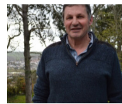
Cliciwch yma am broffil Richard