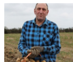
Cliciwch yma am broffil Romeo