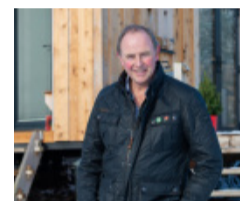
Cliciwch yma am broffil Keri