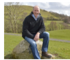
Cliciwch yma am broffil Dafydd