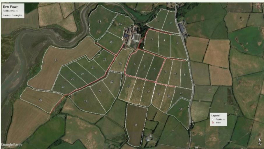
Ffig 1. Isadeiledd y fferm wedi'i fapio gan Precision Grazing

Mae safle arddangos Erw Fawr yng Nghaerdybi, Ynys Môn eisau cynyddu eu cynhyrchiant o borthiant a phorfeydd ar gyfer eu buches o 250 o wartheg Holstein sy'n lloia drwy gydol y flwyddyn. Yn ystod tymor yr hydref 2019, mae'r fferm wedi mapio isadeiledd y fferm ac mae'r wybodaeth wedi cael ei mewnbwnu ar y feddalwedd rheoli glaswellt, AgriNet. Mae staff y fferm wedi bod yn defnyddio mesurydd plât hyd at ddiwedd mis Tachwedd i sicrhau bod cyfnod pori olaf y gwartheg lleihaf cynhyrchiol yn caniatáu lletem laswellt iach ar gyfer y gwanwyn yn barod i droi'r gwartheg allan ar ddechrau Mawrth. Bydd unrhyw wartheg cynhyrchiol iawn hyd at 150 diwrnod mewn llaeth yn cael eu cadw dan do drwy'r flwyddyn, gan sicrhau bod modd defnyddio silwair glaswellt ac india corn o ansawdd uchel yn effeithlon.