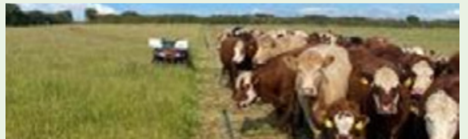
Ffigur 2. Gwartheg yn pori ar system gylchdro ar safle arddangos Bryn.

Amcangyfrifir fod defnyddio ddwysfwyd yn strategol ar fferm Bryn yn cynnig enillion blynyddol o +£1,988, gan ystyried y cynnydd pwysau ychwanegol sy'n gyfwerth â £1,700 rhwng 34 tarw, yn ogystal ag arbedion o £908 ar gyfer siediau. Mae'r cyfanswm hefyd yn ystyried colledion o £620 drwy fwydo haidd wedi'i rollo a cheirch yn gynharach yn y tymor.