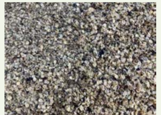
Ffigur 1. Pys a ffa wedi'u crychu

Mae prisiau protein yn tueddu i fod yn ansefydlog iawn, ac ar hyn o bryd, maent yn llawer uwch nag yr oeddynt flwyddyn yn ôl, felly bydd tyfu'r cnwd protein yn helpu i sicrhau bod y system besgi biff ym Mhantyderi yn gadarn ac yn gwella cynaliadwyedd a chymwysterau amgylcheddol cynhyrchu biff Cymreig.