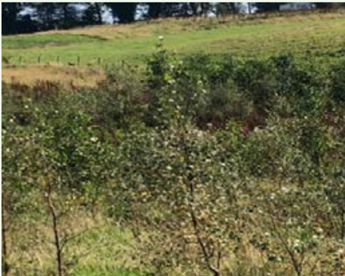
Ffigwr 1. Fferm Moelogan Fawr.

Neges allweddol – er bod plannu a sefydlu coetir newydd yn eithriadol o bwysig mae angen rhoi pwyslais clir ar gynllunio rhaglen barhaus o ofal a chynnal a chadw ar ôl plannu sy'n ganolog i greu amodau i'r coed ymsefydlu'n llwyddiannus.