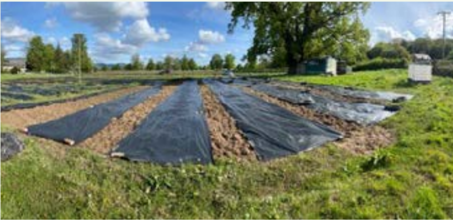
Ffigwr 1. Menter dewis eich hun Cae Derw gan ddefnyddio dull dim cloddio.

Gyda chefnogaeth gan Cyswllt Ffermio, cafodd prosiect ei sefydlu, wedi'i anelu er mwyn datglybu gardd farchnad ecolegol-gadarn, ariannol-hyfyw a fydd yn cynnwys ffrwythau, llysiau, cnydau salad a blodau trwy ddefnyddio'r dull dim turio. Byddai'r prosiect hefyd yn archwilio'r defnydd o wllân yn hytrach na chardfwrdd fel sylfaen i atal chwyn. Y prif amcan i Cae Derw yw tyfu mor naturiol ac mor ecolegol â phosibl, gan ddefnyddio adnoddau lleol megis compost di-fawn a thail buarth o'r fferm drws nesaf.