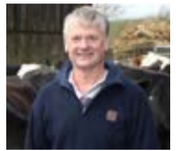
Cliciwch yma i weld proffil Haydn