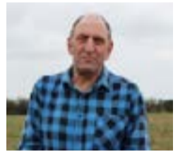
Cliciwch yma i weld proffil Romeo