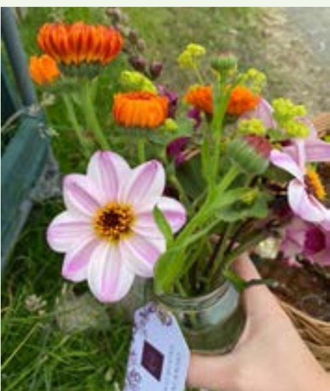
Ffigwr 2: Blodau jar jam yn cael eu casglu a'u torri gan y cyhoedd a'u trefnu'n sypiau eu hunain.

Plannwyd bylbiau blodau trwy Mypex, sydd, er yn fwy llafurus bellach, yn lleihau'r chwynnu yn y gwanwyn. Roedd yr ymateb gan y cyhoedd, gan ddechrau gyda'r arwerthiannau cennin Pedr ym mis Mawrth yn wych. Datblygwyd llinell newydd mewn blodau jariau jam a phrofodd hyn i fod yn boblogaidd wrth i amrywiaeth y blodau gynyddu. Anogwyd y cyhoedd i gasglu a thorri blodau a threfnu eu sypiau eu hunain. Roedd y gwelyau blodau uchel ar gyfer diwrnodau PYO yn boblogaidd iawn ac yn llwyddiannus yn ariannol, felly, y bwriad yw gwneud mwy o'r rhain yn 2022, gan ddechrau gyda bylbiau'r gwanwyn.