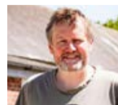
Cliciwch yma i weld proffil Jim