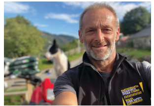
Alun Elidyr Llysgennad Partneriaeth Diogelwch Fferm Cymru

Os byddwch chi'n ymrwymo HEDDIW i roi'r dulliau gweithredu a diogelu sydd wedi'u hargymell yn y llyfryn hwn ar waith (dulliau sy'n amlgu rhai o'r pethau mwyaf cyffredin a rhwystradwy a allai achosi damweiniau ar eich fferm), byddwch chi'n helpu lleihau'r risg o farwolaeth neu anafiadau difrifol ar eich cyfer chi, aelodau o'ch teulu a'ch gweithwyr.