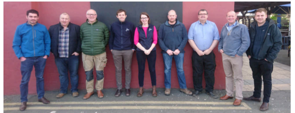
Uchod: Y grŵp o ffermwyr o ogledd Cymru sy'n gweithio ar y prosiect EIP ar Genomeg

Mae'r canlyniadau hyn yn dangos bod profion genomeg yn adnodd hanfodol i ffermwyr Ilaeth er mwyn gallu dethol heffrod i'w defnyddio ar gyfer bridio, ac i gynyddu gwelliannau geneteg o fewn y fuches.