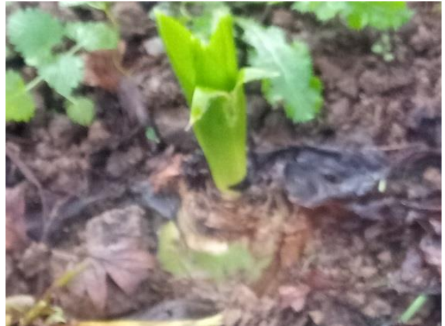
Llun agos o'r bwlb