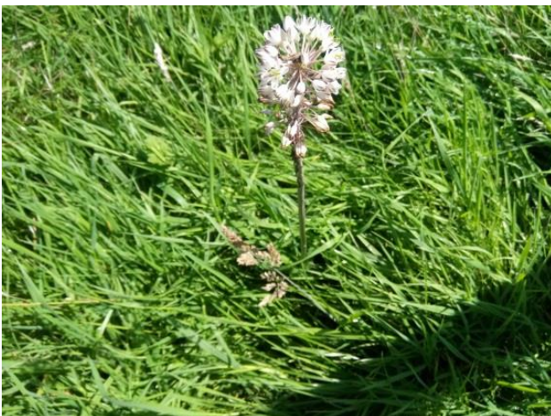
Bwlb serennyn yn blodeuo