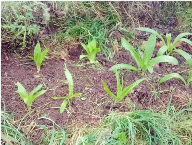
Blagur newydd yn fuan ar ôl plannu

Mae'r aildyfu wedi'i gofnodi a rhagwelir y bydd y bylbiau'n cael eu cynaeafu yn ystod mis Mehefin / dechrau Gorffennaf.