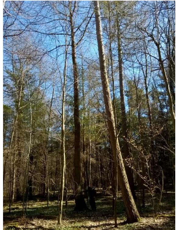
Ceirios gwyllt. Mae'r corun yn dda ac mae'r GF a blannwyd oddi tano'n tyfu'n arafach (=llai o ysgwyd). Hefyd, nid oes modd iddo dyfu uwchben y ceirios. Mae'r ffurf yn nodweddiadol o Geirios Gwyllt -h.y gyda rhigolau ar y gwaelodion, a heb fod yn rhy syth.