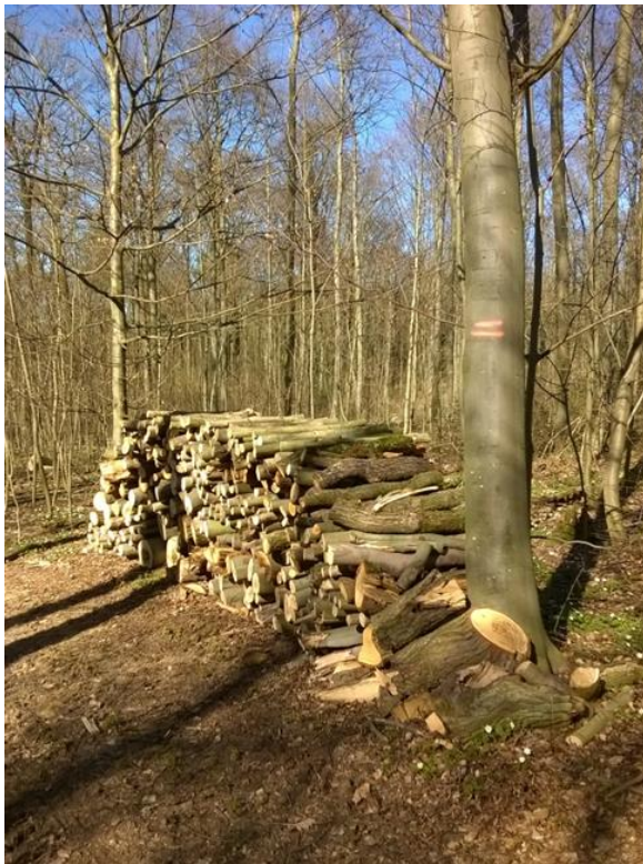
Coed tân yn barod i'w gasglu at ddefnydd domestig – y cynnyrch coedwig isaf o ran gwerth (€50/metr ciwbig)