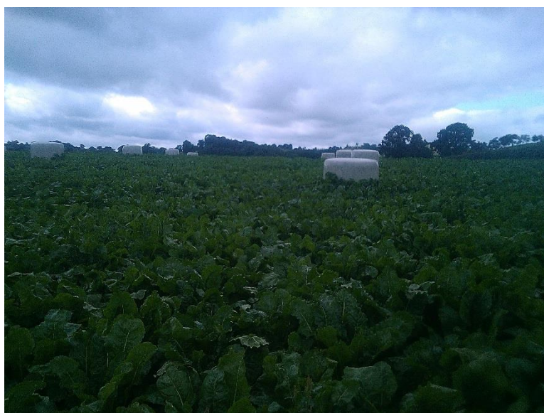
Bety's porthiant a byrnau yn barod at y gaeaf yn Trefnant Hall