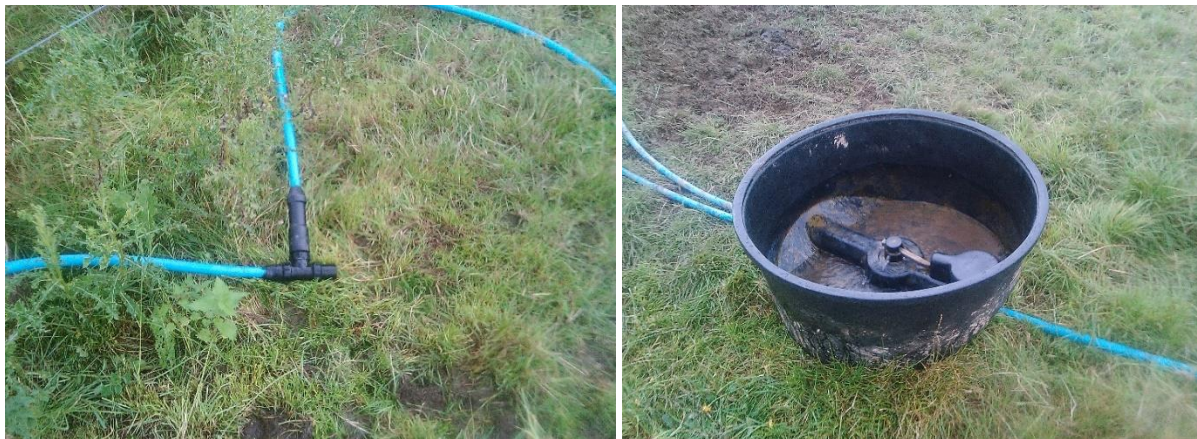
Hydrant syml a chafn symudol yn Partridge Farm