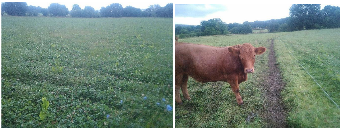
Porfa lyseiuol a bustach 18 mis oed yn ei phori yn Partridge Farm