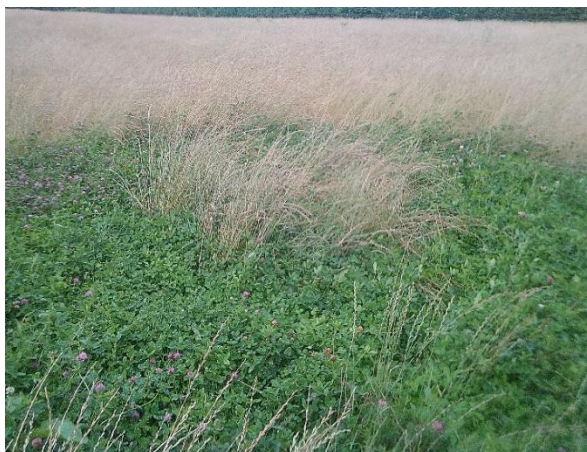
Meillion coch yn tyfu ar ôl eu porthi fel byrnau i'r heffrod ar y borfa ohiriedig dros y gaeaf. Maent wedi cael eu gadael i hadu i geisio'u gwasgaru i bob rhan o'r cae (Partridge Farm)