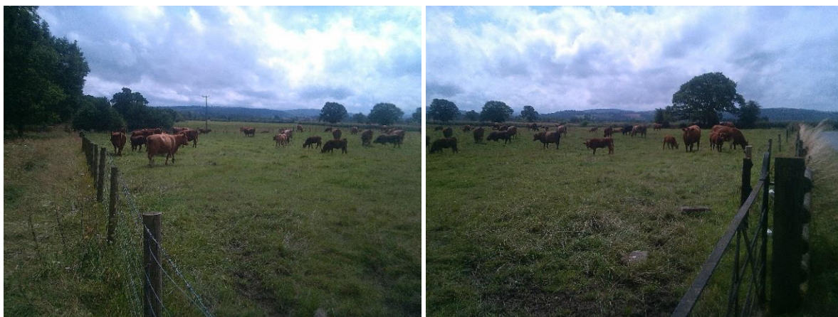
40 o fuchod a lloi yn pori llain 1ha fel rhan o gylchdro 2 ddiwrnod yn Partridge Farm