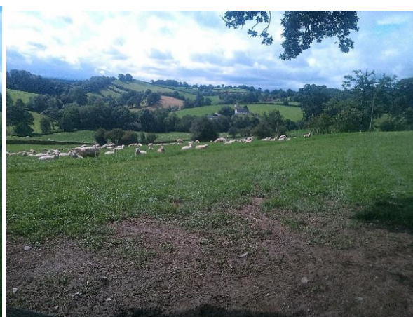
Criw o ŵyn ar gylchdro 1 diwrnod ar feillion coch yn Trefnant Hall