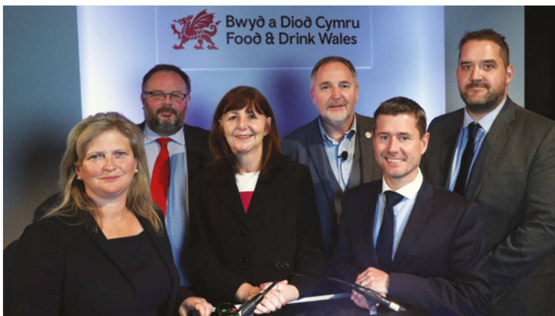
Ysgrifennydd y Cabinet dros Ynni, Cynllunio a Materion Gwledig, gydag aelodau'r Bwrdd a rhanddeiliaid eraill yng nghynhadledd 'Buddsoddi mewn Sgiliau: Buddsoddi mewn Twf' a gynhaliwyd yn yr hydref