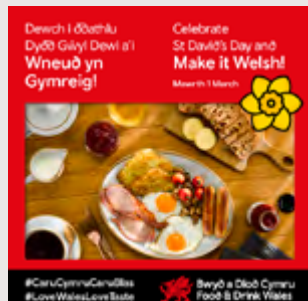
Fframiau y gellir eu haddasu