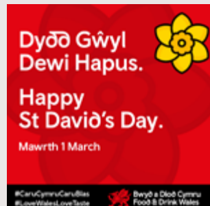
Hysbyseb digidol generig