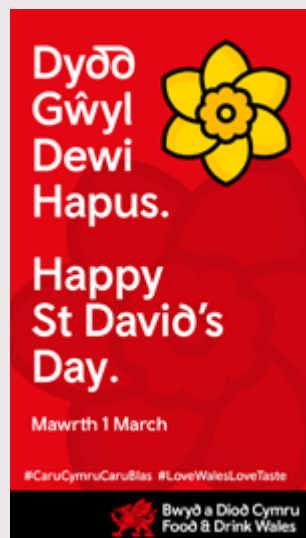
Hysbyseb cyffredinol ar gyfer Straeon/ Riliâu ar Facebook ac Instagram.