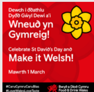
Hysbyseb digidol generig