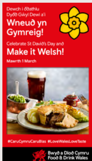
Fframiau y gellir eu haddasu ar gyfer Straeon / Riliâu ar Facebook ac Instagram.