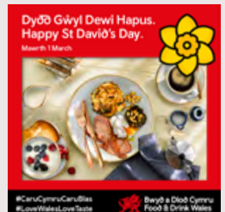
Fframiau y gellir eu haddasu