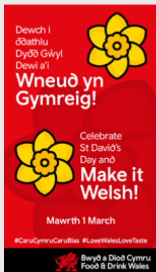
Hysbyseb cyffredinol ar gyfer Straeon/ Riliâu ar Facebook ac Instagram.