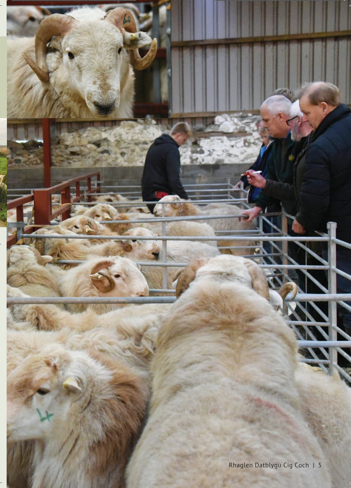
Rhaglen Datblygu Cig Coch | 5