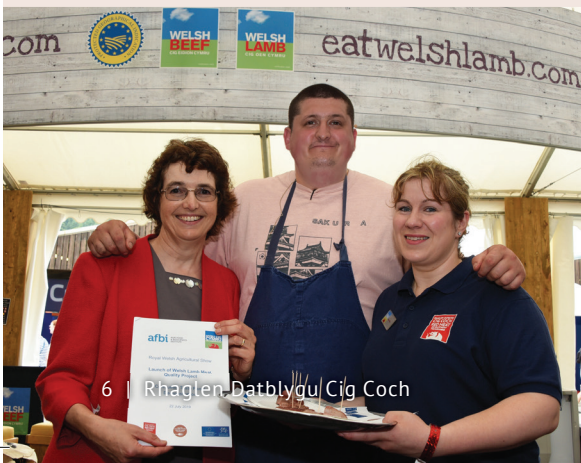
6 | Rhaglen Datblygu Cig Coch

Yn ogystal, bydd gwaith yn cael ei wneud ar ddatblygu dealltwriaeth ddofn o anghenion cwsmeriaid a'u hagweddau tuag at Gig Oen Cymru.