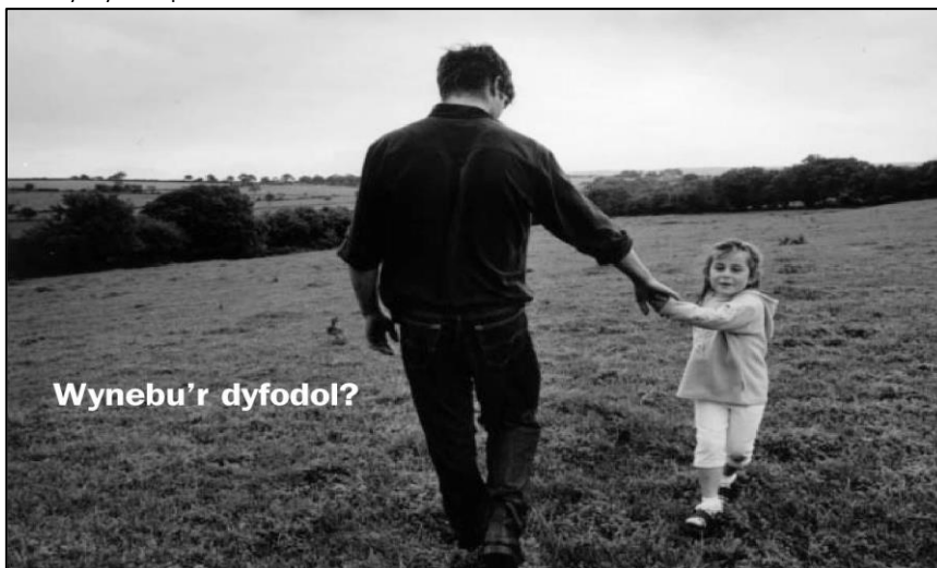
Ffoto hyrwyddo'r prosiect

Fel a ddengys yr adroddiad hwn mae tonnau'r darlledu a grewyd gan Ymbweru trwy Ddarlledu wedi bod nid yn unig yn amrywiol ac eang ond hefyd yn ddadlennol.