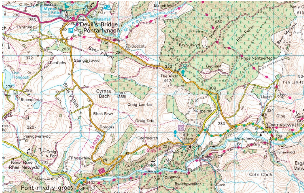
Figure 1: Proposed study area