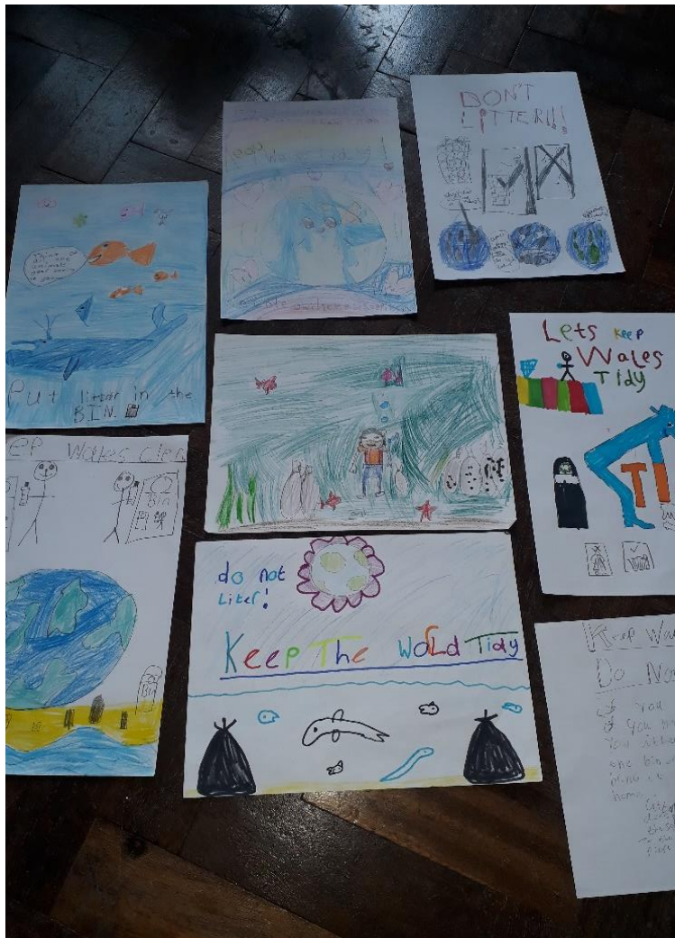
Delwedd: Gwaith plant ar negeseuon sbwriel.

Mae prosiect Litterless yn brosiect wedi ei anelu at annog Eco-bwyllgorau i feddwl am ffyrdd arloesol