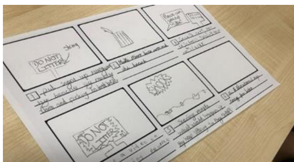
Delwedd: Gwaith plant ar negeseuon sbwriel.

"Hoffwn weld mwy o finiau ailgylchu ar y traeth er mwyn i bobl allu eu defnyddio" (Disgybl Bl. 6)